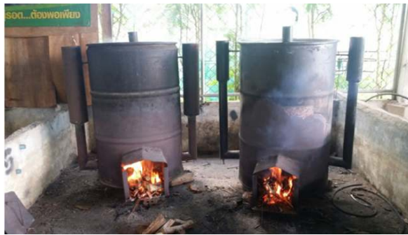
ภาพ 1 การเผาตัวอย่างเพื่อให้ได้ถ่านด้วยเตาเผาขนาด 200 ลิตร

การเตรียมสาร นำโปแตสเซียมไฮดรอกไซด์ (KOH) เจือจางด้วยน้ำด้วย Volumetric flask ให้ได้ความเข้มข้นร้อยละ 5 ส่วนการเตรียมตัวประสาน โดยใช้แป้งมันสำปะหลังจำนวน 50 กรัม ปรับปริมาตรเท่ากับ 1,000 มิลลิลิตร โดยใช้ความอุณหภูมิ 70 องศาเซลเซียส คนให้เข้ากัน จะได้ความเข้มข้นของน้ำแป้งเท่ากับร้อยละ 5 (Reddy, et al., 2018) ส่วนการเตรียมสารละลายแป้งมันสำปะหลังที่ร้อยละ 1 และ 3 จะใช้แป้งที่ 10 และ 30 กรัม และปรับปริมาตร ให้ความอุณหภูมิตามสภาวะข้างต้น