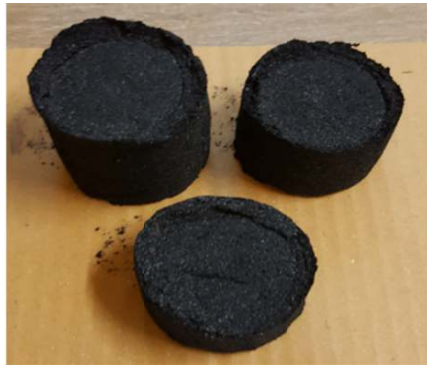
ภาพ 2 ลักษณะผลิตภัณฑ์ที่ผ่านกระบวนการคาร์บอนไนเซชัน

จากการศึกษาสถานะที่เหมาะสมในการพัฒนาผลิตภัณฑ์ดูดซับกลิ่นจากชานอ้อยพบว่าชานอ้อยที่ผ่านการตากแดดเป็นระยะเวลา 3 วัน นำมาเผาในเตาเผาขนาด 200 ลิตร เป็นเวลา 1 ชั่วโมง แล้วนำมาบดแล้วร่อนให้ละเอียด แล้วนำมาย่อยโดยใช้โปแตสเซียมไฮดรอกไซด์ (KOH) ที่ความเข้มข้น 1 กับ 5 เปอร์เซ็นต์ โดยน้ำหนักต่อปริมาตร เป็นเวลา 3 ชั่วโมง จากนั้นขึ้นรูปโดยใช้แป้งมันสำปะหลังที่ 1, 3 และ 5 เปอร์เซ็นต์ แล้วนำมาอบที่อุณหภูมิ 100 องศาเซลเซียส ดังแสดงในภาพ 2