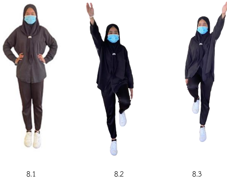
ภาพที่ 2.8 การยกเข่า

8. การยกเข่า เป็นท่าการเคลื่อนไหวพื้นฐานในการพัฒนากล้ามเนื้อขาได้อย่างดี