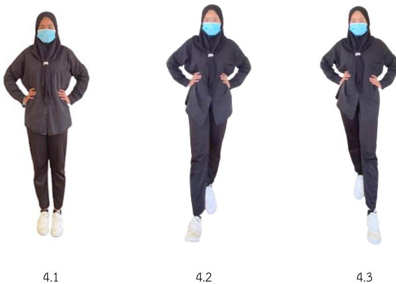
ภาพที่ 2.4 สันเท้าตะปลายเท้าตะ

4. สันเท้าตะปลายเท้าตะ คือ การตะด้วยสันเท้าหรือปลายเท้าการตะสันเท้าหรือปลายเท้า