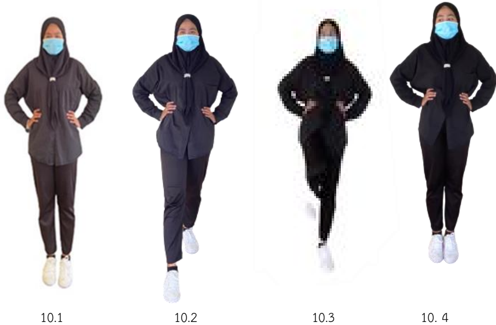
ภาพที่ 2.10 การเตะขา

10. การเตะขา การเตะไปด้านหน้า เตะเท้าซ้ายและขวาสลับกัน การเตะขาที่ถูกต้องควรเป็นการเตะทั้งขา ไม่ใช่การเตะสับแต่