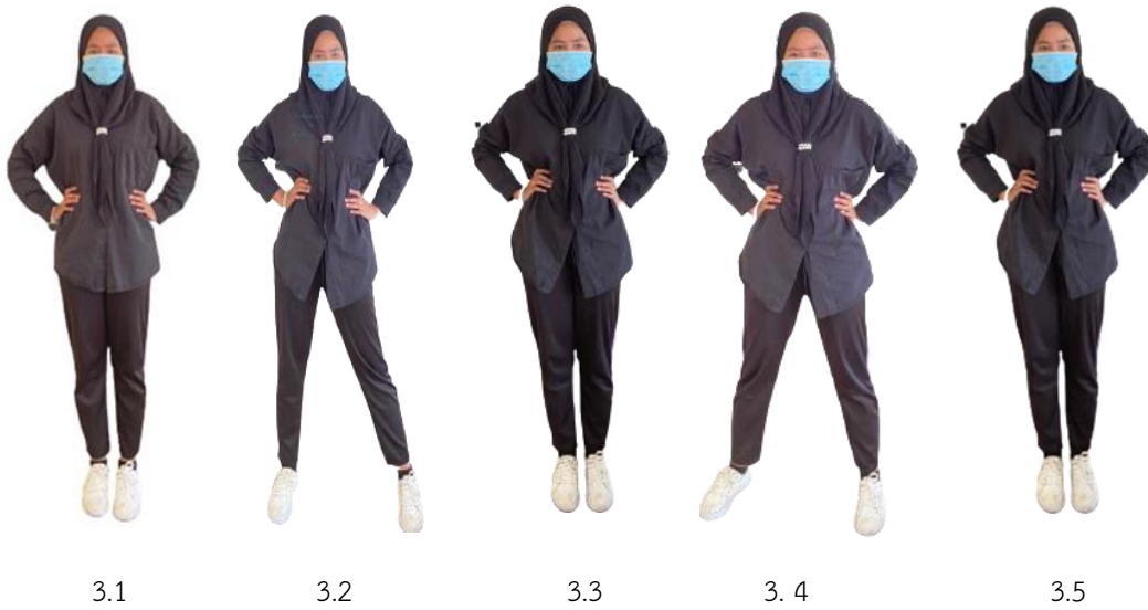
ภาพที่ 2.3 การก้าวตะ

3. การก้าวตะ หมายถึง การยกเท้าใดเท้าหนึ่งไปด้านข้าง แล้วยกเท้าอีกข้างหนึ่งไปตะแล้วทำสลับกัน ทิศทางการเคลื่อนไหวจะเป็นการก้าวตะที่อยู่กับที่