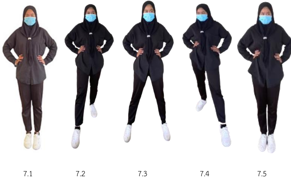
ภาพที่ 2.7 ก้าวรูปตัววี

7. ก้าวรูปตัววี คือการก้าวเท้าเป็นรูปตัววี (V) จะใช้เท้าใดเท้าหนึ่งเป็นเท้านำก็ได้ ถ้าใช้เท้าซ้ายนำก็เรียกว่า V-Step ซ้าย ในการทำนองเดียวกัน ถ้าใช้เท้าขวานำก็เรียกว่า V-Step ขวา ในการทำV-Step ทำได้ทั้ง V-Step หน้าหรือ V-Step หลัง ก็ได้