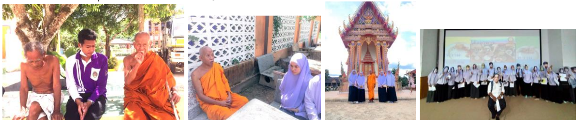
ภาพที่ ๓-๑ การเรียนรู้และปรับตัวข้ามวัฒนธรรม

จากการสังเกตผู้เรียนเข้าใจความแตกต่างของสังคมพหุวัฒนธรรม เรียนรู้การอยู่ร่วมกันในสังคมอย่างสันติ รู้จักการปรับตัวให้สอดคล้องกับวัฒนธรรมท้องถิ่น ยอมรับความคิด ภาษา การแต่งกาย และอาหารที่หลากหลาย มุ่งเน้นให้ผู้เรียนลงพื้นที่เรียนรู้การอยู่ร่วมกัน ทำความเข้าใจ เรียนรู้วิถีท้องถิ่น เพื่อนำข้อมูลมาวิเคราะห์ และประยุกต์ใช้ในการคิดแก้ปัญหาต่อไป