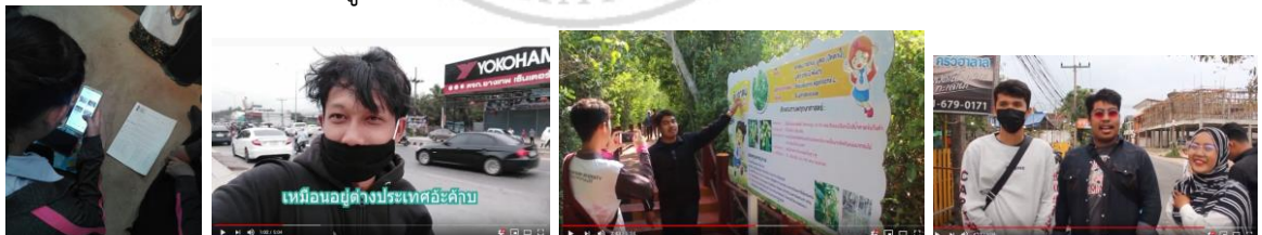
ภาพที่ ๓-๔ การดำเนินชีวิตในสังคมยุคดิจิทัล

ผู้เรียนสามารถประยุกต์ใช้เทคโนโลยีสารสนเทศทางการศึกษาในชีวิตประจำวัน รู้เท่าทันสื่อ สามารถนำองค์ความรู้ในรายวิชาที่เรียนมาบูรณาการร่วมกับรายวิชาอื่น ดำรงตนเป็นพลเมืองที่ดีของสังคม สามารถจัดทำสื่อสารสนเทศ สร้างความรู้ความเข้าใจและภาพลักษณ์ที่ดีของมหาวิทยาลัย