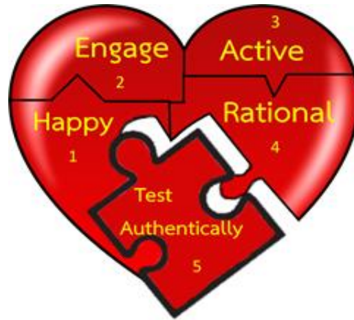
ภาพที่ ๒-๒ ขั้นตอนการจัดการเรียนรู้ห้องเรียนขนาดใหญ่ในศตวรรษที่ ๒๑ HEART Model

ขั้นที่ ๑ H (Happy) เปิดใจ ขั้นนี้มุ่งเน้นให้ผู้เรียนรู้จักคุณค่าของตนเอง ยอมรับในความต่างซึ่งกันและกัน โดยดำเนินกิจกรรมที่เน้นให้ผู้เรียนได้ละลายพฤติกรรม สามารถปรับตัวอยู่ร่วมกันกับเพื่อนต่างสาขา