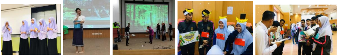
ภาพที่ ๓-๒ การสื่อสารได้อย่างมีประสิทธิภาพ

ผู้เรียนสามารถพัฒนาขีดความสามารถ ทักษะการอ่าน การพูด การเขียนในภาษาที่ตนศึกษาได้อย่างมีประสิทธิภาพ โดยสามารถนำองค์ความรู้ที่ได้รับไปปรับใช้ในสถานการณ์ต่าง ๆ ของชีวิตจริง ซึ่งมุ่งเน้นให้ผู้เรียนมีความเชื่อมั่นในตนเอง สามารถใช้ภาษาได้อย่างเหมาะสม และสามารถเป็นแบบอย่างในการใช้ภาษาที่สร้างสรรค์