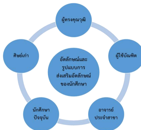
ภาพที่ 1 กรอบแนวคิดในการวิจัย

งานวิจัยนี้ได้กำหนดกรอบแนวคิดของการศึกษาอัตลักษณ์ และรูปแบบการส่งเสริมอัตลักษณ์ของนักศึกษาสาขาวิชานิติศาสตร์ คณะวิทยาการจัดการ มหาวิทยาลัยราชภัฏยะลา ดังนี้