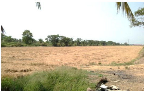
Fig. 4 Paddy field after harvest in Nong Sue District, Pathum Thaneer Province

การเก็บเกี่ยวจะเก็บเกี่ยวผลผลิตจะใช้วิธีการจ้างรถเกี่ยว เพราะสะดวกและรวดเร็ว ผลผลิตที่ได้ประมาณ 300-1,000 กิโลกรัม/ไร่ โดยเฉลี่ย 700-800 กิโลกรัม/ไร่ ผลผลิตที่ได้จะจำหน่ายหมด มีทั้งการจำหน่ายเองให้กับโรงสี และเข้าโครงการรับจำนำข้าวเปลือกของ ธกส. แต่หลังจากไม่มีโครงการรับจำนำข้าว เกษตรกรจะขายให้กับโรงสีทั้งหมด ส่วนฟางข้าวและตอซึ่งที่เหลือจากการเก็บเกี่ยว มีการทำลายทิ้งโดยการเผา การปล่อยให้เน่า และมีการนำมาทำเป็นฟางก้อนอัดเพื่อจำหน่าย (Fig. 4)