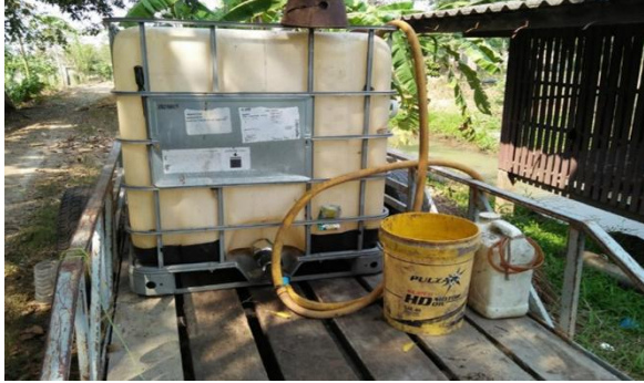
Fig. 6 Chemical mixing tank

ฉีดพ่นสารเคมีกำจัดศัตรูพืชในช่วงเวลา เช้าและเย็น หลังจากฉีดสารเคมีแล้วจะนำภาชนะที่ใช้ฉีดพ่นล้างทำความสะอาดให้เรียบร้อย และมีการทำความสะอาดร่างกายด้วยการล้างมือและอาบน้ำก่อนกลับเข้าบ้าน แต่ยังคงพบเกษตรกรยังไม่มีการกำจัดบรรจุภัณฑ์ที่ใช้หมดแล้วให้ถูกต้อง (Fig. 6)