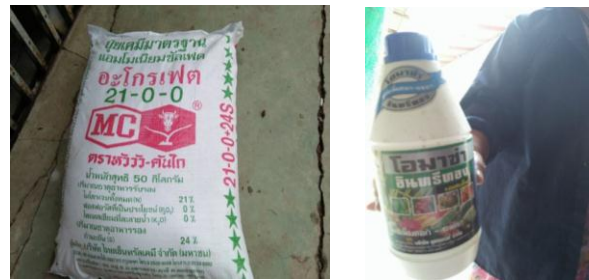
Fig. 5 Chemical fertilizer and pesticide application in paddy field

ได้แก่ 21-0-0, 46-0-0, 16-20-0, 15-15-15, 13-13-21 และ 16-16-16 ปริมาณที่ใส่อยู่ที่ 25 กิโลกรัมต่อไร่ ทุกหลังคาเรือน มีการใส่ปุ๋ยทั้งหมด 2 ครั้ง คือ ครั้ง 1 บำรุงต้นข้าวครั้งที่ 2 บำรุงรวงข้าวสวนสารเคมีป้องกันกำจัดศัตรูพืชจะเป็นประเภทสารกำจัดแมลงเช่น หนอนกอ หนอนมันใบแมลงสิง แมลงกะแท้ หนอนเจาะสมอฝ้าย เพลี้ยอ่อน และเสี้ยนดิน มีชื่อการค้า อะบาแม็กดินพริวารอนคลอร์ไพริฟอส ไอโซปีวทิลเอสเทอร์+โพพานิล ขณะที่สารเคมีกำจัดวัชพืชและหญ้าที่ใช้ มีชื่อการค้า ไกลโฟเซต ราวอ๊อฟ พาราควอท (Fig. 5) นอกจากนี้ คือ สารเคมีป้องกันโรคพืชที่ใช้ มีชื่อการค้า ฟุจิ-วัน และสารเคมีเพิ่มผลผลิตของข้าวที่ใช้มีชื่อการค้า โอปาซ่า เป็นต้น ในช่วงของการทำนามจะมีการใช้สารเคมีกำจัดศัตรูพืช 3 ครั้ง แต่ครั้งที่พ่นสารเคมีกำจัดศัตรูพืชใช้เวลาจนถึง 4-6 ชั่วโมง/ครั้ง ซึ่งเกษตรกรจะผสมยาใช้ตามปริมาณตามฉลากผลิตภัณฑ์นั้นกำหนดไว้ การเลือกซื้อสารเคมีกำจัดศัตรูพืชมีการพิจารณาจากความเหมาะสมกับแมลงที่กำจัด