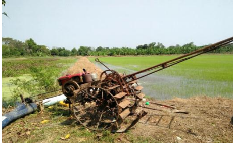
Fig. 3 Rice growing in paddy field in Nong Sue District, Pathum Thaneer Province

รวดเร็ว และทำให้รวงข้าวใหญ่ ข้าวงาม เขียวทนมเขียวนาน ได้ผลผลิตสูงและมีคุณภาพ ระหว่างนั้นหากมีแมลงศัตรูพืช รบกวนก็อาจมีการใช้ยาควบคุมแมลงศัตรูพืช ชนิดของยา และอัตราส่วนที่ใช้ ขึ้นอยู่กับชนิดของแมลงและปริมาณที่ ระบาด