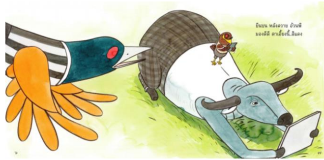
(นกกระปูดตาแดง, 2563 น. 6-7)

3) ด้านมุมมองภาพมีการใช้ 2 รูปแบบคือภาพประกอบทำหน้าที่ควบคู่ไปกับเรื่องและภาพประกอบทำหน้าที่มากกว่าเรื่อง หนังสือนิทานภาพสำหรับเด็กที่เผยแพร่ผ่านเว็บไซต์ happyreading มีการใช้ภาพทำหน้าที่ควบคู่ไปกับเรื่อง 31 เรื่องและภาพประกอบทำหน้าที่มากกว่าเรื่อง 8 เรื่อง ดังตัวอย่าง ภาพประกอบทำหน้าที่ควบคู่ไปกับเรื่องจากเรื่องอานีสกับกอล์ฟสู้โควิด-19