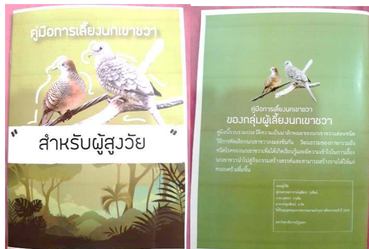
ภาพที่ 3 คู่มือการเลี้ยงนกเขาชวาสำหรับผู้สูงวัยที่ได้พัฒนาขึ้น

2.3 นำเสนอกลับคืนสู่ชุมชนในการประเมินผล กับนำเสนอต่อผู้ทรงคุณวุฒิทางด้านสื่อ เพื่อประเมินคู่มือฯ นำผลการประเมินที่ได้ทั้งสองส่วนกลับมาปรับปรุงแก้ไขคู่มือ โดยมีผู้ทรงคุณวุฒิทางด้านสื่อและทางด้านเนื้อหาการเลี้ยงนกเขาชวา จำนวน 3 ท่าน โดยใช้วิธีการเลือกแบบเจาะจง (Purposive or judgment) คือผู้ทรงคุณวุฒิทางด้านเนื้อหาการเลี้ยงนกเขาชวา ผู้ทรงคุณวุฒิทางด้านเทคโนโลยีสื่อสิ่งพิมพ์ โดยผลการประเมินคู่มือของผู้ทรงคุณวุฒิ ดังแสดงในตารางที่ 1 พบว่า ผู้ทรงคุณวุฒิประเมินในด้านส่วนนำของคู่มือ การใช้ภาษา การออกแบบและจัดรูปแบบของคู่มือ และประเมินภาพรวมของความถูกต้อง เที่ยงตรงของเนื้อหา ข้อมูล และความพึงพอใจที่มีต่อคู่มือการเลี้ยงนกเขาชวาเบื้องต้น อยู่ในระดับมากที่สุด มีเพียงด้านเนื้อหาที่ผลประเมินอยู่ในระดับมาก