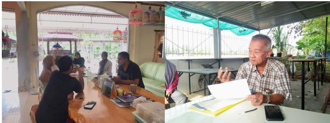
ภาพที่ 2 การสัมภาษณ์เชิงลึกกับผู้รู้ในพื้นที่

2.1 การสร้างเนื้อหา กำหนดรูปแบบ ลักษณะและองค์ประกอบของคู่มือ โดย ได้ศึกษาข้อมูลเกี่ยวกับรูปแบบวิธีการสร้างคู่มือฯ จากเอกสาร/งานวิจัยที่เกี่ยวข้อง รวมทั้งปรึกษาที่ปรึกษาที่เป็นผู้เชี่ยวชาญ ดังแสดงในภาพที่ 2