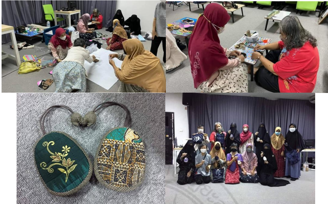
ภาพผู้ประกอบการและสมาชิกกลุ่มชุมชนได้รับเชิญไปเป็นวิทยากรถ่ายทอดความรู้แก่หน่วยงานภายนอก