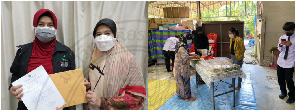
ภาพการมอบรายได้ 151,010 บาทและการตรวจเยี่ยมการจัดอบรมหลักสูตรวิชาชีพระยะสั้น