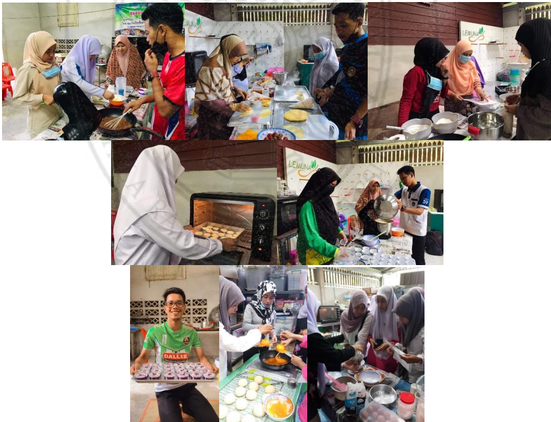
ภาพตัวอย่างการจัดอบรมหลักสูตรวิชาชีพระยะสั้น จำนวน 21 รุ่น