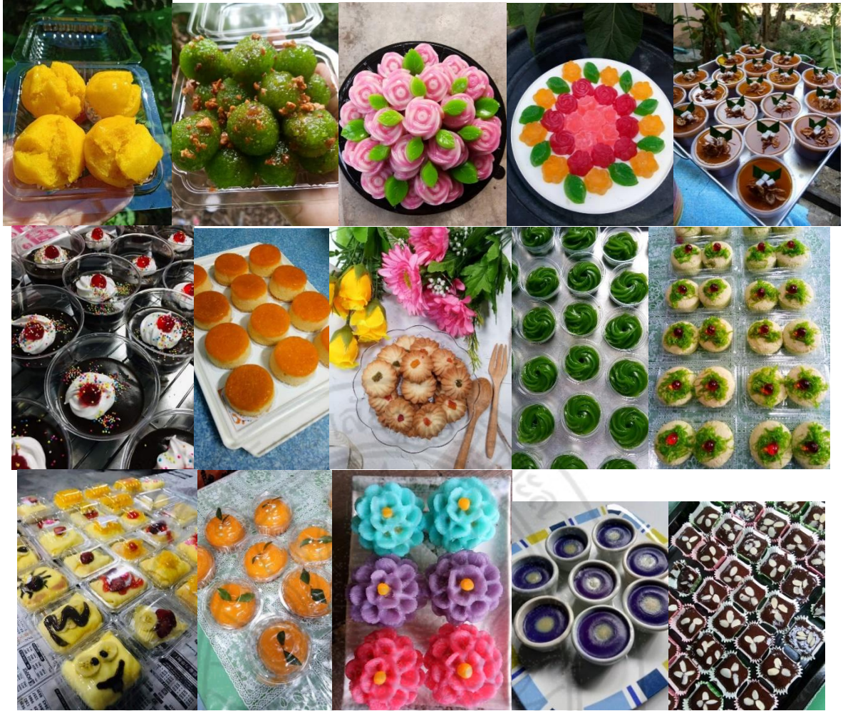
ภาพขนมไทย/พื้นบ้าน/เบเกอรี่ที่จัดการอบรมหลักสูตรวิชาชีพระยะสั้น