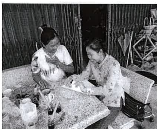
ภาพที่ 1 ประมวลภาพการวิจัยปัจจัยแห่งความสำเร็จของวิสาหกิจชุมชนจังหวัดยะลา