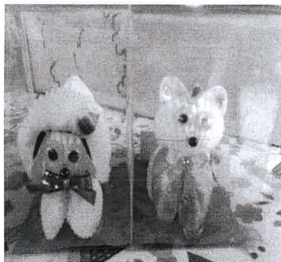
ภาพที่ 1 ประมวลภาพการวิจัยปัจจัยแห่งความสำเร็จของวิสาหกิจชุมชนจังหวัดยะลา (ต่อ)