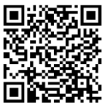
ภาพที่ 3 QR Code วิดีโอการเผยแพร่

ขั้นตอนที่ 6 จัดกิจกรรมถ่ายทอดภูมิปัญญามรดกวัฒนธรรมการละเล่นประจำถิ่น โดยลงพื้นที่ตามสภาพและบริบทจริงตามลำดับที่วางแผนไว้ พบว่า ใช้เวลาในการบันทึกภาพตามบริบทจริงจำนวน 2 วัน อาจเนื่องจาก มีสถานการณ์บางอย่างที่เป็นข้อจำกัด เช่น การเดินทางไปสู่สถานที่จริงแต่ละลำดับค่อนข้างห่างกัน และทางทีมคณะวิจัยไม่ใช่เป็นคนในพื้นที่ อีกทั้งมีช่วงเวลารอคอย ระหว่างกลุ่มผู้เล่นและนักปราชญ์ เป็นต้น ซึ่งแสดงเป็นวิดีโอเพื่อการเผยแพร่งานที่ 3