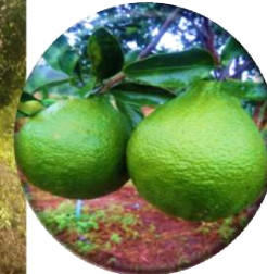
ภาพ 2 ภาพแสดงลักษณะปรากฏของต้นส้มจุกในระยะต่างๆที่สำคัญ การศึกษาวงซีฟ แต่ละขั้นตอนของวงซีฟสามารถสังเกต ได้ไปพร้อมๆ ขั้นตอนการปลูกส้มจุก