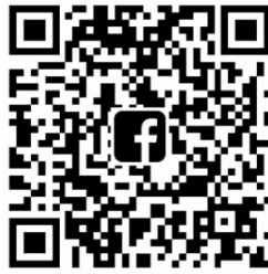
ภาพ 1 ตัวอย่างภาพสัญลักษณ์ QR Code

คิวอาร์โค้ดสามารถนำมาประยุกต์ใช้ได้หลากหลายรูปแบบ เช่น แสดง URL ของเว็บไซต์ ข้อความ เบอร์โทรศัพท์ และข้อมูลที่เป็นตัวอักษรได้อีกมากมาย ปัจจุบันคิวอาร์โค้ดถูกนำไปใช้ในหลาย ๆ ด้าน เพราะสะดวกรวดเร็ว ประโยชน์ที่เห็นได้ชัดที่สุดของคิวอาร์โค้ด คือการแสดง URL ของเว็บไซต์ซึ่งค่อนข้างจะจดจำยาก แต่ด้วยเทคโนโลยีคิวอาร์โค้ดทำให้สามารถสแกนข้อมูลผ่านผลิตภัณฑ์ต่าง ๆ เช่น นามบัตร นิตยสาร ฯลฯ (วินัย ฤทธิเกษม, 2556) วิธีใช้งานคิวอาร์โค้ดสามารถใช้งานผ่านโทรศัพท์มือถือที่มีโปรแกรมอ่านสัญลักษณ์คิวอาร์โค้ดอยู่ จากนั้นนำกล้องที่อยู่บนมือถือสแกนบนคิวอาร์โค้ด เครื่องจะอ่านคิวอาร์โค้ดสีดาออกมาเป็นตัวหนังสือที่มีข้อมูลมากมาย เช่น รายละเอียดสินค้าโปรโมชั่น สถานที่ตั้งของบริษัท ร้านค้า เว็บไซต์ เบอร์โทรศัพท์ หากอยู่บนนามบัตร เจ้าของนามบัตรก็จะใส่ ทั้งชื่อ และอีเมลล์ ฯลฯ (ดวงกมล นาคะวิจนะ, 2554)