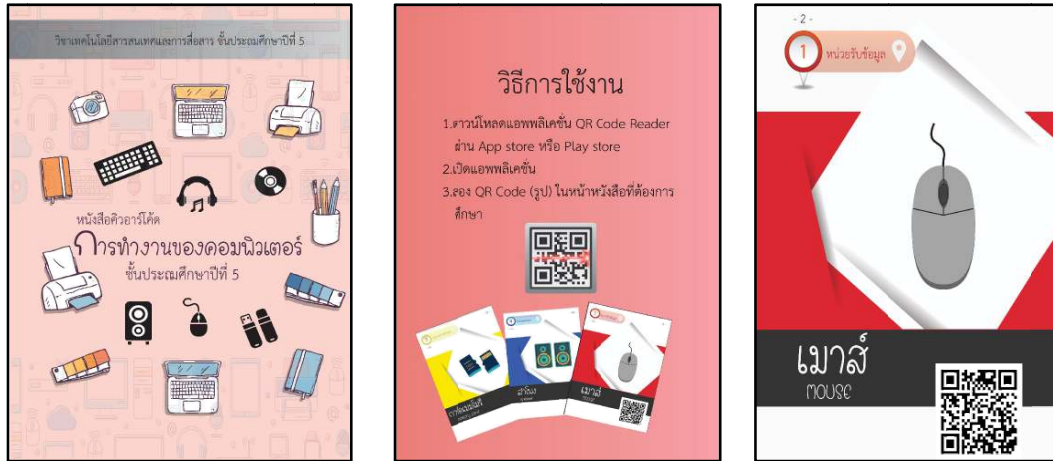
ภาพ 4 ตัวอย่างหน้าหนังสือเทคโนโลยีคิวอาร์โค้ดที่พัฒนาขึ้น

3.2 การสร้างบทเรียน หลังจากได้เตรียมข้อความ ภาพ เสียง และส่วนอื่น ๆ เรียบร้อยแล้ว ขั้นตอนต่อไปเป็นการสร้างบทเรียนโดยใช้โปรแกรมคอมพิวเตอร์จัดการเพื่อเปลี่ยนสตอรี่บอร์ดให้กลายเป็นบทเรียนเทคโนโลยี คิวอาร์โค้ด ทั้งนี้การประยุกต์ใช้เทคโนโลยีคิวอาร์โค้ดในการพัฒนาหนังสือ รายวิชาเทคโนโลยีสารสนเทศ และการสื่อสาร เรื่อง การทำงานของคอมพิวเตอร์ สำหรับนักเรียนชั้นประถมศึกษาปีที่ 5 ผู้วิจัยได้ใช้สื่อเทคโนโลยี คิวอาร์โค้ด เพื่อทำให้บทเรียนมีความน่าสนใจและส่งเสริมให้นักเรียนเข้าใจเนื้อหาได้ดียิ่งขึ้น ได้แก่ ภาพนิ่ง ภาพเคลื่อนไหว และเสียงบรรยายประกอบ เป็นต้น โดยพัฒนาขึ้นสอดคล้องตามสาระการเรียนรู้การทำงานอาชีพ และเทคโนโลยีระดับชั้น ประถมศึกษาปีที่ 5 ดังภาพ 2