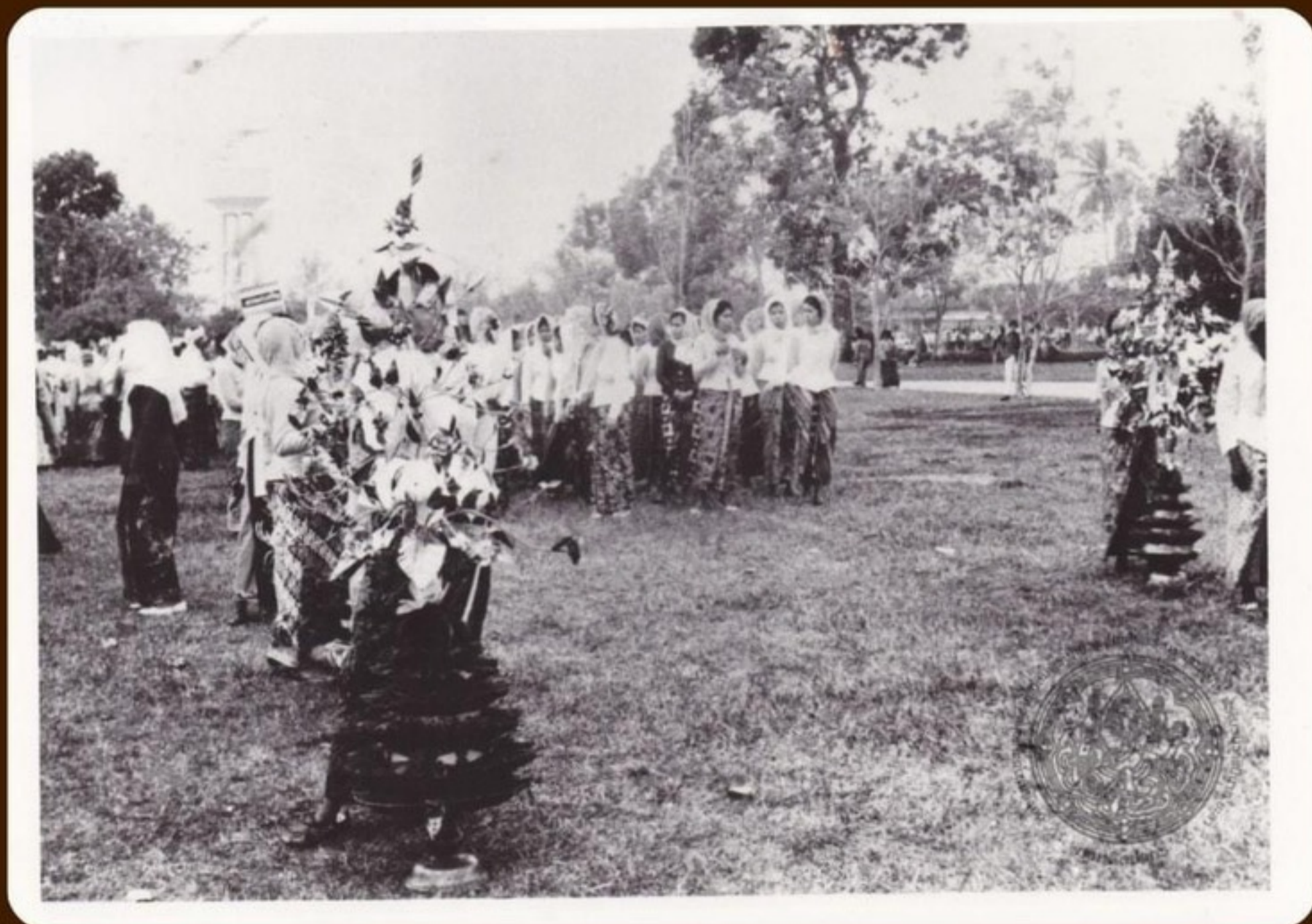
ภ ยล (อ) 1.1.37 (7) ภาพขบวนแห่บุหงาซีเร๊ะในพิธีรับ และขึ้นระวางสมโภชพระเศวตสุรคชาธารฯ ระหว่างวันที่ 9-11 มีนาคม 2511