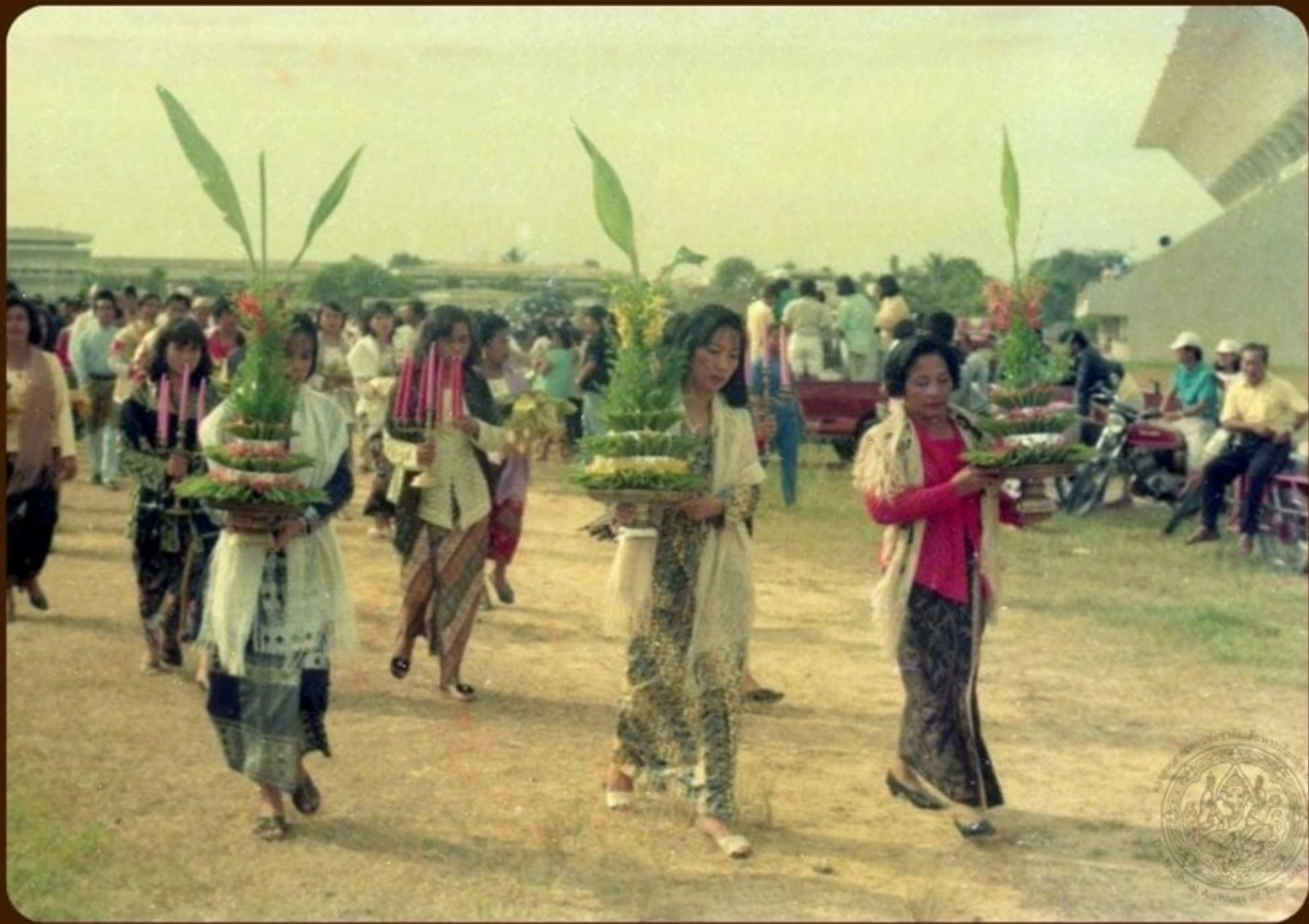
ภาพขบวนแห่บุหงาซีเร่ งานประเพณีของดีเมืองยะลา

เอกสารสำนักงานประชาสัมพันธ์จังหวัดยะลา รหัสดิจิทัล na06d-neg0070000130-0014