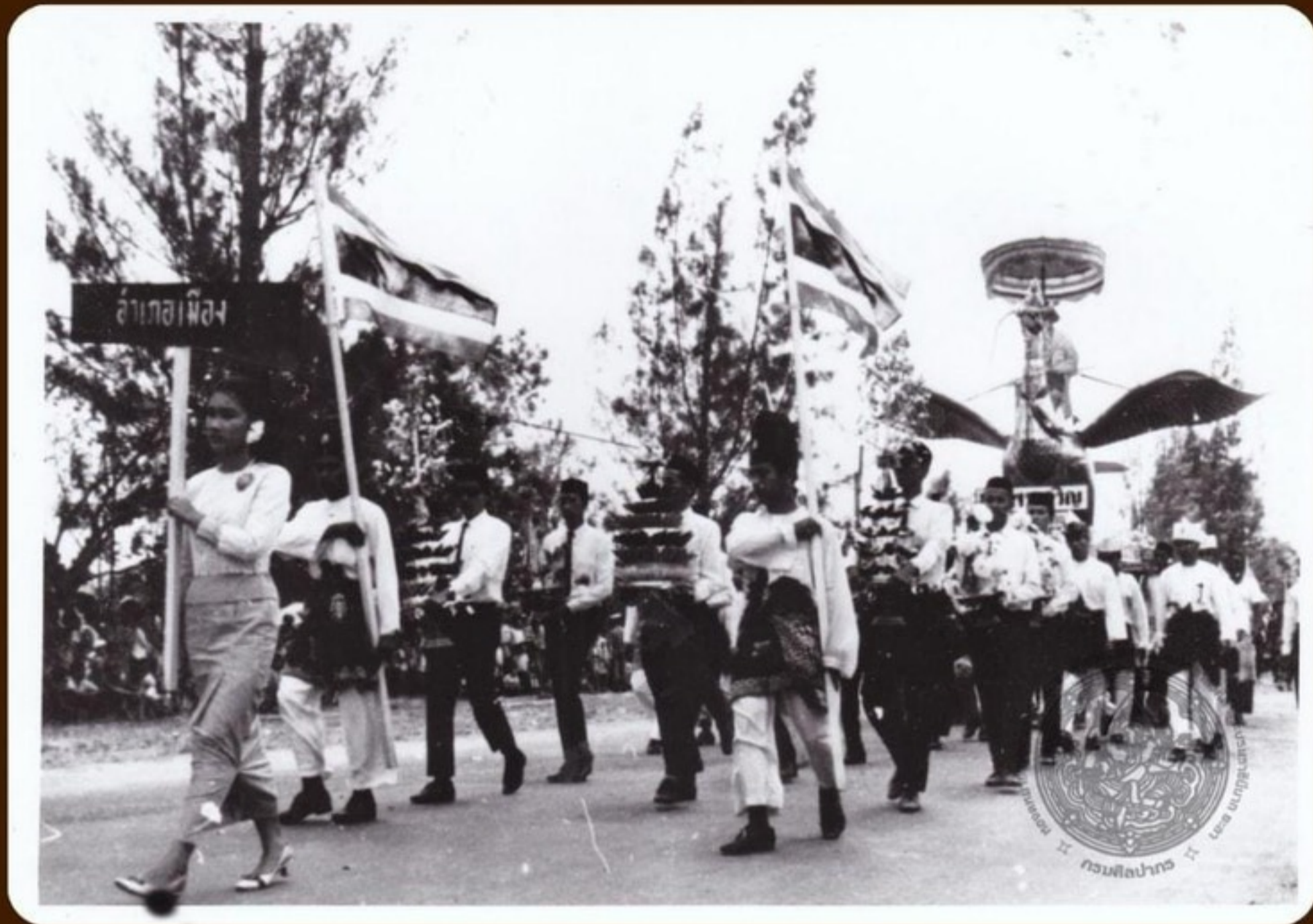
ภ ยล (อ) 1.1.37 (32) ภาพขบวนแห่บุหงาซีเร๊ะในพิธีรับ และขึ้นระวางสมโภชพระเศวตสุรคชาธารฯ ระหว่างวันที่ 9-11 มีนาคม 2511