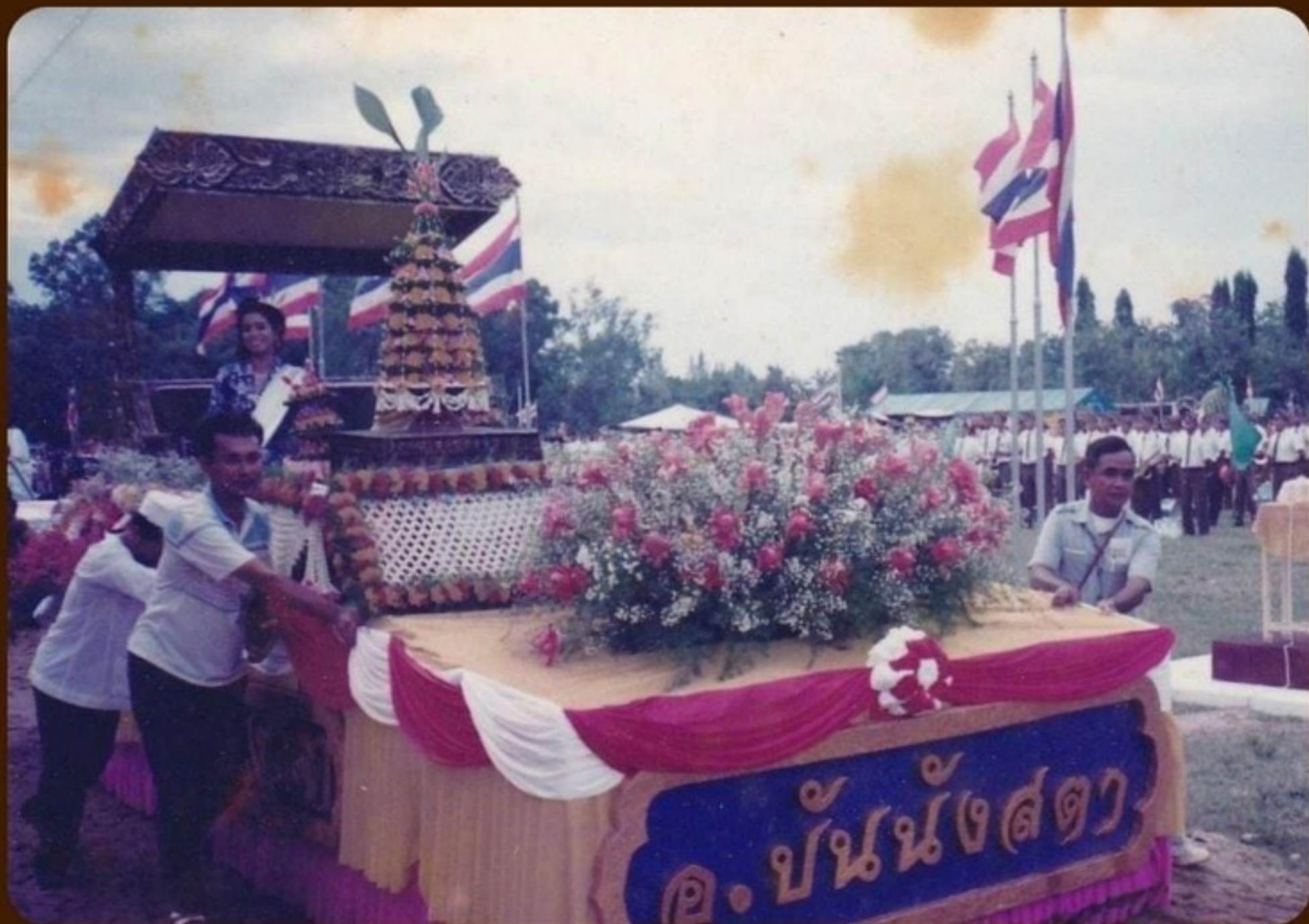
ภาพขบวนแห่บุหงาซีเร่ งานประเพณีของดีเมืองยะลา พ.ศ.2537

เอกสารสำนักงานประชาสัมพันธ์จังหวัดยะลา รหัสดิจิทัล na06d-neg0070000130-0014