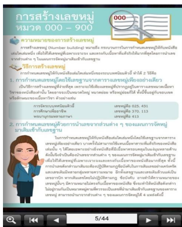
ภาพที่ 4 เนื้อหาวิธีการสร้างเลขหมู่หนังสือ

ส่วนเนื้อหาและรูปภาพกราฟิก เนื้อหาบทเรียนประกอบด้วย ตอนที่ 1 การสร้างเลขหมู่หนังสือ หมวด 000 -900 และตอนที่ 2 ตอนที่ 3 การให้เลขหมู่หมวด 000 ถึง 900 ได้แก่ เลขหมู่หมวด 000 วิทยาการคอมพิวเตอร์ สารนิเทศ และเบ็ดเตล็ด เลขหมู่หมวด 100 ปรัชญาและจิตวิทยา เลขหมู่หมวด 200 ศาสนา เลขหมู่หมวด 300 สังคมศาสตร์ เลขหมู่หมวด 400 ภาษา เลขหมู่หมวด 500 วิทยาศาสตร์ เลขหมู่หมวด 600 เทคโนโลยี, เลขหมู่หมวด 700 ศิลปะ เลขหมู่หมวด 800 วรรณคดี ประพันธ์ศาสตร์ และการวิจารณ์ เลขหมู่หมวด 900 ประวัติศาสตร์ซึ่งผู้เรียนสามารถเรียนรู้และวิเคราะห์เลขหมู่หนังสือได้ตามหมวดหมู่