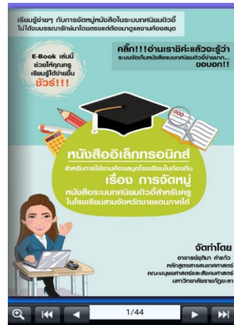
ภาพที่ 3 หน้าปกหนังสืออิเล็กทรอนิกส์E-book

ส่วนเนื้อหาและรูปภาพกราฟิก เนื้อหาบทเรียนประกอบด้วย ตอนที่ 1 การสร้างเลขหมู่หนังสือ หมวด 000 -900 และตอนที่ 2 ตอนที่ 3 การให้เลขหมู่หมวด 000 ถึง 900 ได้แก่ เลขหมู่หมวด 000 วิทยาการคอมพิวเตอร์ สารนิเทศ และเบ็ดเตล็ด เลขหมู่หมวด 100 ปรัชญาและจิตวิทยา เลขหมู่หมวด 200 ศาสนา เลขหมู่หมวด 300 สังคมศาสตร์ เลขหมู่หมวด 400 ภาษา เลขหมู่หมวด 500 วิทยาศาสตร์ เลขหมู่หมวด 600 เทคโนโลยี, เลขหมู่หมวด 700 ศิลปะ เลขหมู่หมวด 800 วรรณคดี ประพันธ์ศาสตร์ และการวิจารณ์ เลขหมู่หมวด 900 ประวัติศาสตร์ซึ่งผู้เรียนสามารถเรียนรู้และวิเคราะห์เลขหมู่หนังสือได้ตามหมวดหมู่