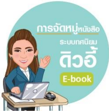
ภาพที่ 2 สามารถดาวน์โหลดเป็นแอปพลิเคชัน หนังสืออิเล็กทรอนิกส์ โดยสามารถเรียนรู้ผ่านมือถือได้

ส่วนหน้าจอหลัก หน้าจอหลักประกอบด้วย คำนำ คำชี้แจงการใช้และสารบัญ ซึ่งผู้เรียนสามารถเข้าสู่บทเรียนผ่านลิงค์เว็บไซต์หรือสามารถดาวน์โหลดเป็นแอปพลิเคชันเรียนรู้ผ่านมือถือที่กำหนด