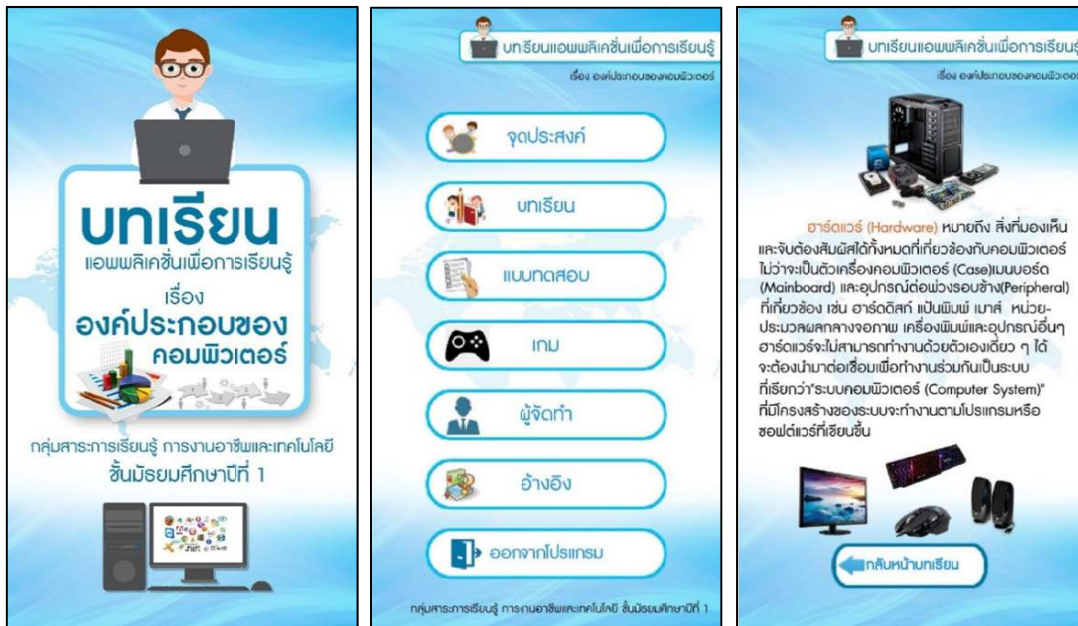
ภาพ 2 หน้าจอแอปพลิเคชันเพื่อการเรียนรู้

มัธยมศึกษาปีที่ 1 ที่ปรับปรุงแก้ไขแล้วเสนอผู้เชี่ยวชาญ 3 ท่าน เพื่อตรวจสอบความถูกต้องเหมาะสม และแบบประเมินคุณภาพด้านเนื้อหาของแอปพลิเคชันเพื่อการเรียนรู้ เรื่อง องค์ประกอบคอมพิวเตอร์ สำหรับนักเรียนชั้นมัธยมศึกษาปีที่ 4 ที่ทำการปรับปรุงแก้ไขตามข้อเสนอแนะ ทั้งนี้การออกแบบและพัฒนาแอปพลิเคชันเพื่อการเรียนรู้ วิชาการงานอาชีพและเทคโนโลยี สำหรับนักเรียนชั้นมัธยมศึกษาปีที่ 1 ผู้วิจัยใช้รูปแบบสื่อมัลติมีเดีย เพื่อให้บทเรียนมีความน่าสนใจ และส่งเสริมให้นักเรียนเข้าใจเนื้อหาได้ดียิ่งขึ้น ได้แก่ ข้อความ ภาพกราฟิก เป็นต้น โดยพัฒนาขึ้นสอดคล้องตามสาระการเรียนรู้การงานอาชีพและเทคโนโลยีระดับชั้นมัธยมศึกษาปีที่ 1 ดังภาพ 2