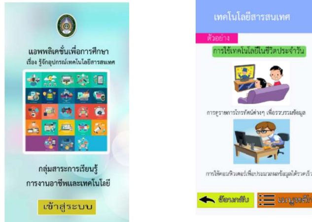
ภาพ 3 ตัวอย่างหน้าจอแอปพลิเคชันบนโทรศัพท์มือถือระบบปฏิบัติการแอนดรอยด์

3) พัฒนา (Development) ในการพัฒนาแอปพลิเคชันฯ ครั้งนี้ ใช้โปรแกรมหลักในการพัฒนา ดังนี้ โปรแกรม Thinkable โปรแกรม Adobe Photoshop และ โปรแกรม Adobe Illustrator ซึ่งผลการพัฒนาแอปพลิเคชันฯ ดังภาพ 3