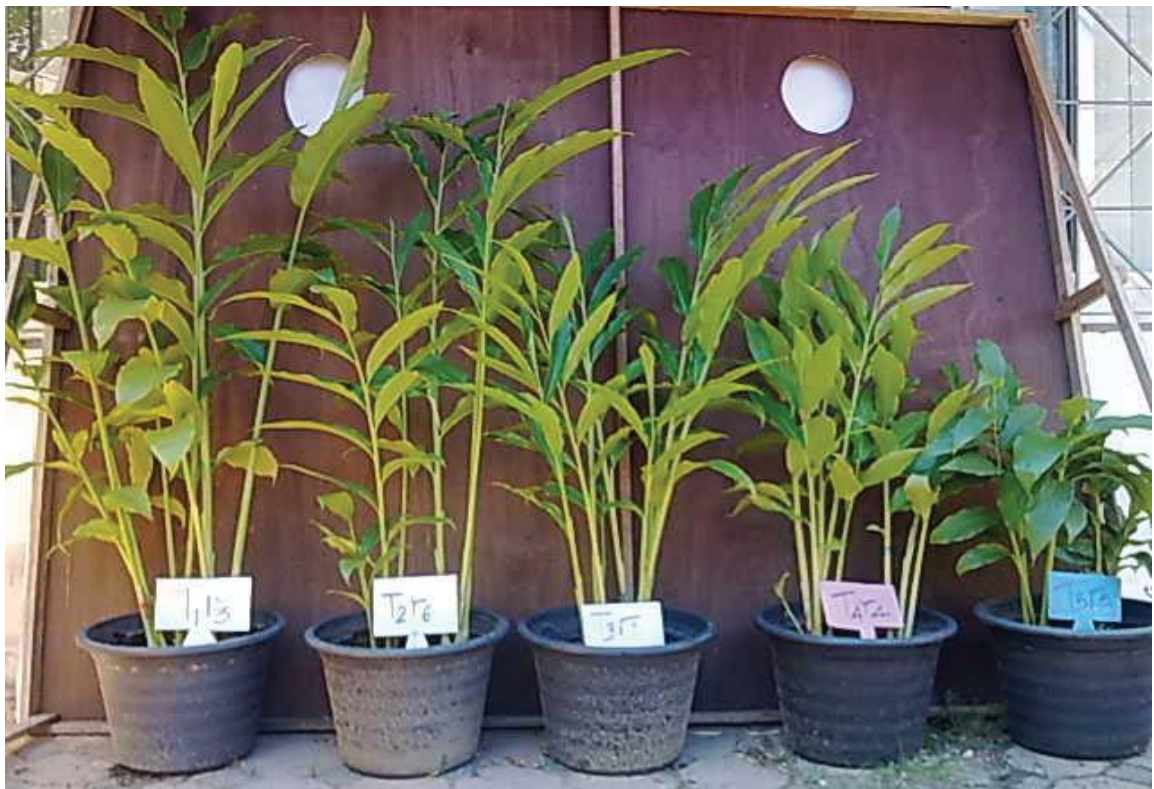
0 100 200 300 400 ความเข้มข้นของพาคโคลบิวทราโซล (มก/ล)